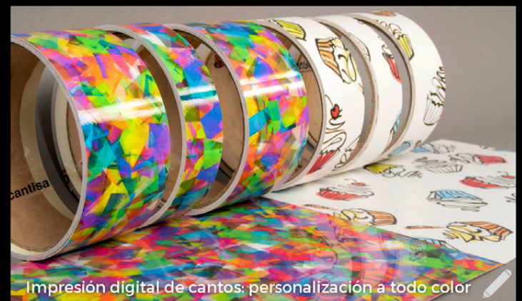
Impresión digital de cantos: personalización a todo color

Además, dispone de una colección llamada "Cantos que Decoran", concebida para agregar valor a los muebles e interiores, donde el cubrecanto toma protagonismo y se convierte en un elemento decorativo y diferenciador.