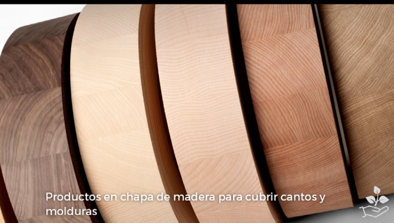
Productos en chapa de madera para cubrir cantos y molduras