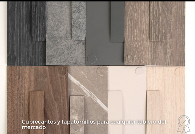
Cubrecantos y tapatornillos para cualquier tablero del mercado